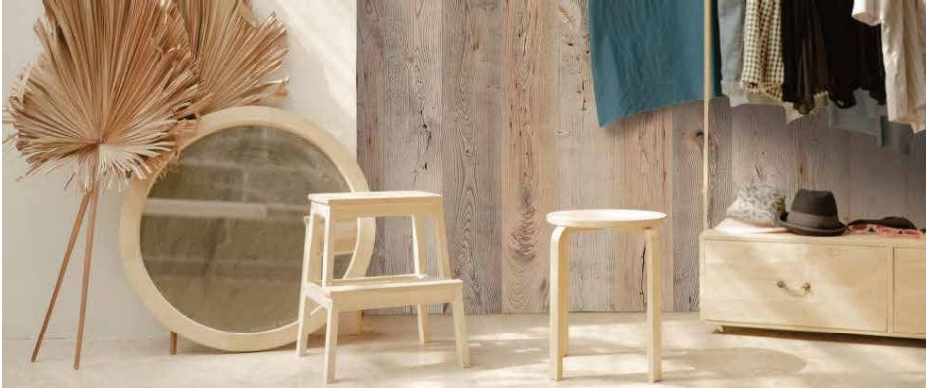
壁材施工イメージ：ニレ