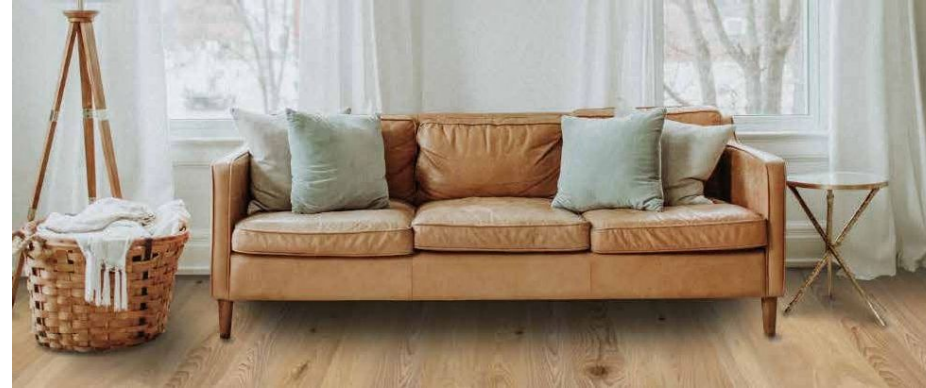
フローリング施工イメージ：セン