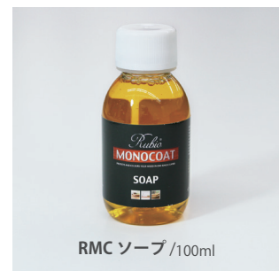
RMC ソープ /100ml

※薄めたソープ用のバケツ、モップの汚れをすすぐ水用のバケツ、の2つを用意すると効率的です。