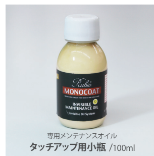
専用メンテナンスオイル タッチアップ用小瓶 /100ml

フローリングの表面にキズが付くなどして部分補修が必要となった場合、スクラッチ傷の深さにもよりますが、専用メンテナンスオイルを使用してタッチアップ補修するとキズ跡が目立ちにくくなります。特殊なケースの場合は弊社までお問い合わせください。