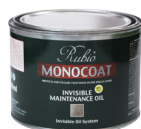
専用メンテナンスオイル メンテナンス用缶 500ml (75～100㎡分) ¥9,000