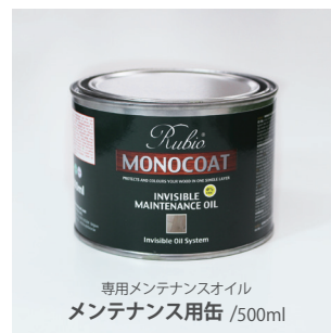
専用メンテナンスオイル メンテナンス用缶 /500ml