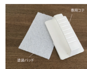
専用キット 専用コテ ¥590/個 専用パッド ¥250/枚