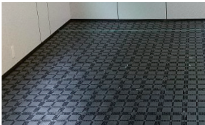
OA フロア下地 — 樹脂製パネル

冬場等、暖房器具による室内の極端な乾燥は、割れや反り、伸縮等の原因になりますので、加湿器等での湿度の調節をお勧めします。