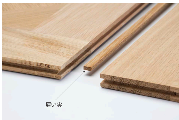
接合面の溝に「雇い実」をはめ込んで接着剤で接合する

(※1) フル・グルーダウン工法(全面接着工法)：床材の裏面全体に専用の接着剤を均一に塗布し、下地に直接貼り付ける施工方法です。